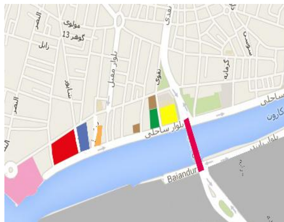
مجاورت ها ↑